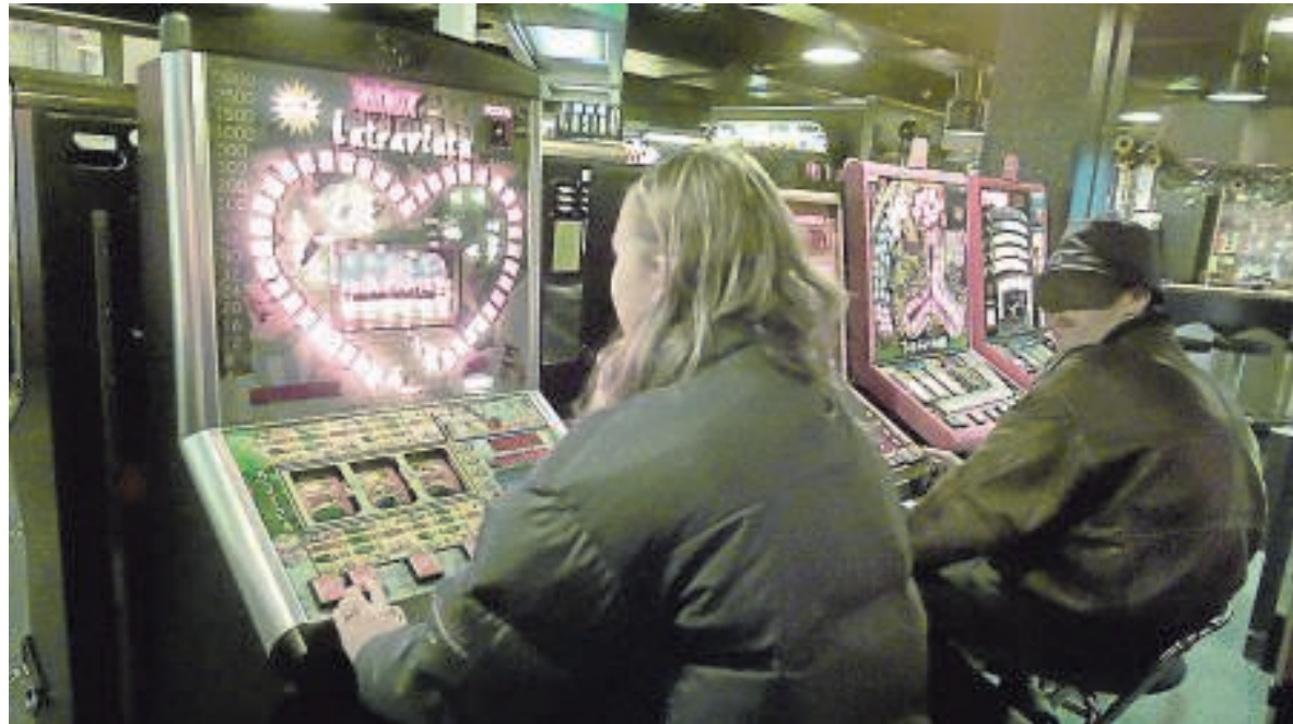
Zwei Personen spielen in einer Spielhalle. Immer wieder werden diese Orte überfallen.

„Das Schlimme ist: In der Zeit nach dem Überfall macht man sich